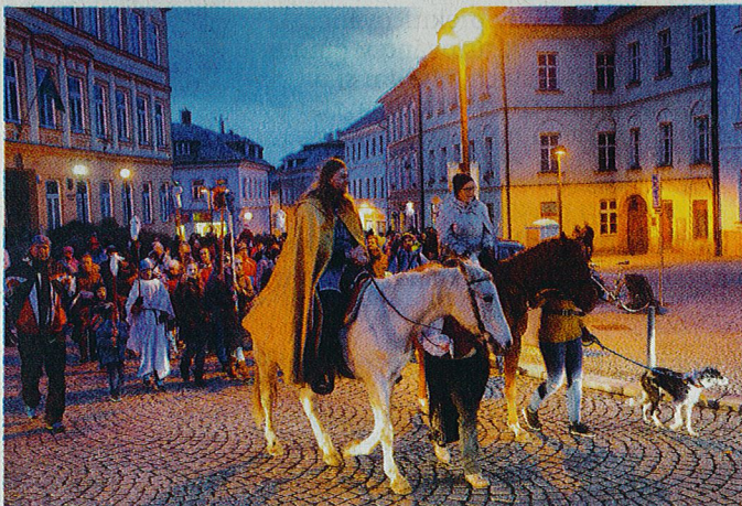
MARTINSKÝ PRŮVOD. Oslavy ve Šternberku

Na hřbetu ne úplně pravého bělouše vystřídal svou manželku, která se za rouškou kostýmu vydávala za sněhového krále několik sezon předtím. Manželé a především jejich koně jsou zvyklí na pozornost. Hlavnímu zvířecímu hrdinovi Enricovi ji věnovali všichni,