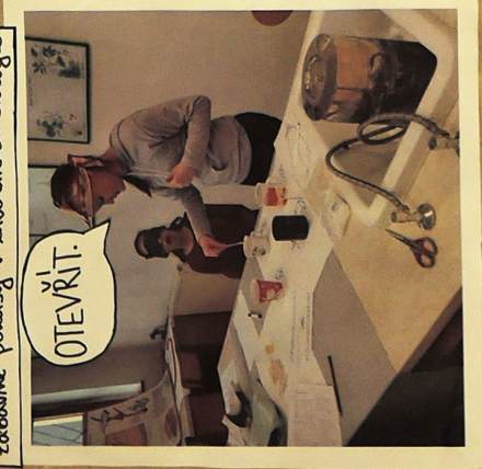
Zaborné pokusy v laboratorii biologije.